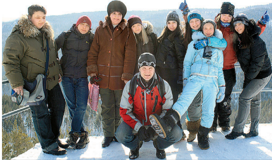
Выходные 9 «В» и классный руководитель часто проводят на природе - вот и сейчас выбрались на «Столбы».